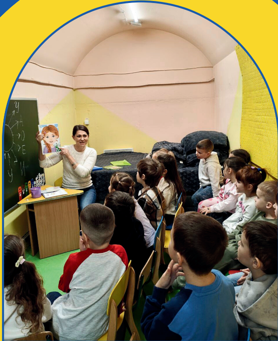
Kinder in einem Schutzkeller in Hostomel