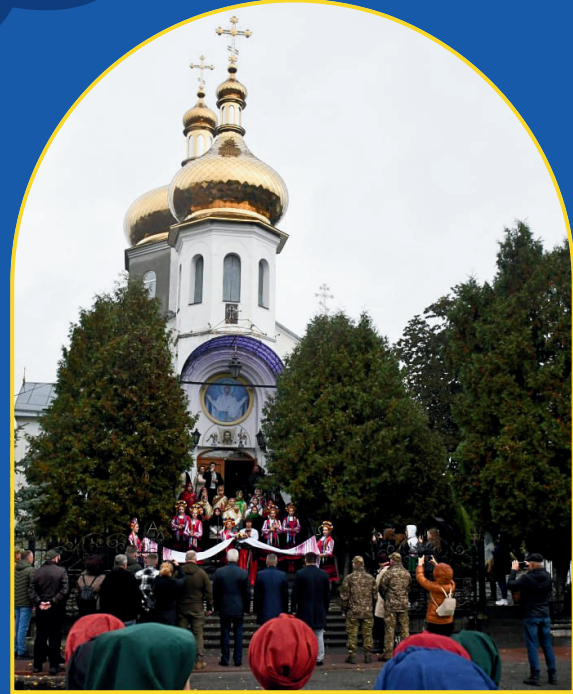
Die Mariä-Schutz-Kirche, Hostomel